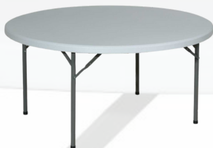
Table ronde 152 cm 8/9 pers