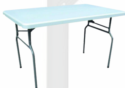
Table rectangulaire 122/76 cm 4 pers