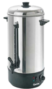
distributeur eau chaude