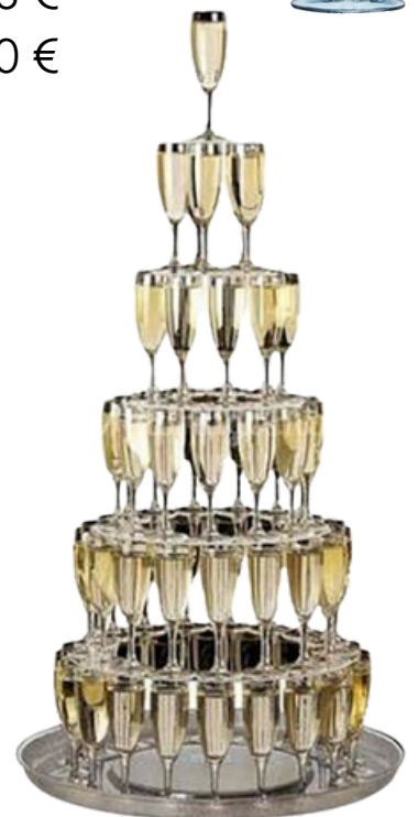
fontaine à champagne