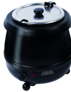
marmite à soupe