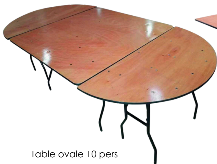
Table ovale 10 pers