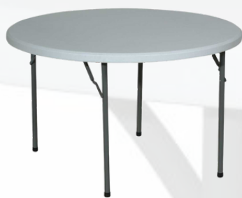
Table ronde 122 cm 6/7 pers