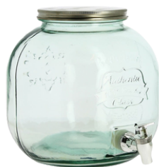
fontaine à cocktail