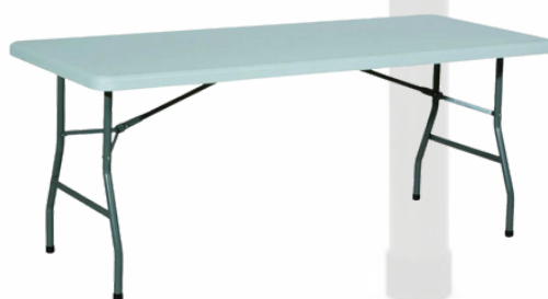
Table rectangulaire 183/76 cm 6 pers