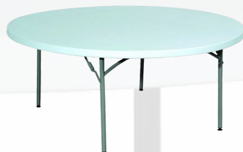
Table ronde 183 cm 10/11 pers