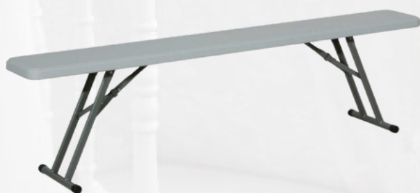
Banc pliant 3 places